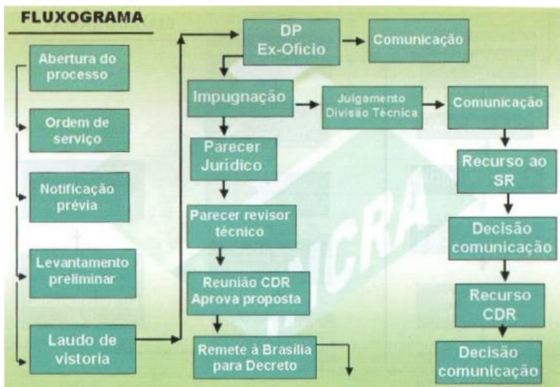
Figura 1. Cartilha com fluxograma do procedimento desapropriatório.

A cartilha sobre desapropriação aborda todos os possíveis passos para a desapropriação de um imóvel, desde a identificação da grande propriedade até como se calculam os índices de produtividade para verificação da possibilidade de desapropriação. Traz todas as leis e como são executadas suas determinações pelo órgão federal, ao final apresentando um fluxograma do procedimento desapropriatório.